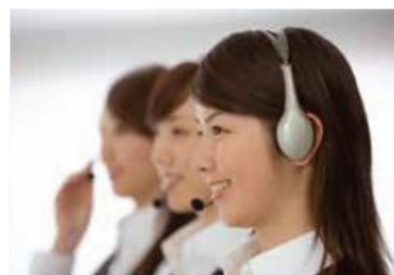
KOWA 健康コンシェルジュ イメージ

KOWA 健康コンシェルジュでは、注文や販売に関するお問い合わせだけではなく、生活者の健康習慣をサポートするご相談窓口を設置しています。サプリメントアドバイザーの資格を持つ「KOWA 健康コンシェルジュ」が、サプリメントを中心としたご質問に丁寧にお答えいたします。