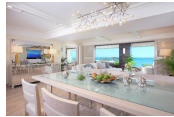
1つのフロアに1室のみ、各部屋 200㎡を超える贅沢なつくり