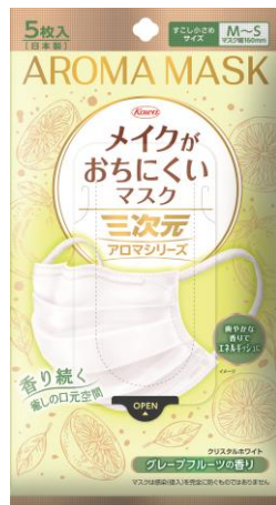
左 「カラーシリーズ」クリスタルホワイト 右 「アロマシリーズ」グレープフルーツの香り

ムレにくくやさしい肌あたりで着け心地がよい「ふわさらメイクキープシート」を口元側に採用し、メイク崩れを防ぎます。