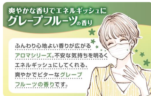
「アロマシリーズ」グレープフルーツの香り