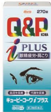
キューピーコーワ i プラス (第3類医薬品) 効能・効果 眼精疲労・肩こりの症状緩和