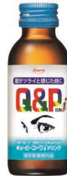
キューピーコーワ i ドリンク (指定医薬部外品) 効能・効果 栄養不良に伴う眼疲労の改善、疲労回復